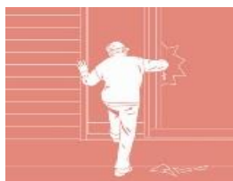
外出・在宅時の防犯