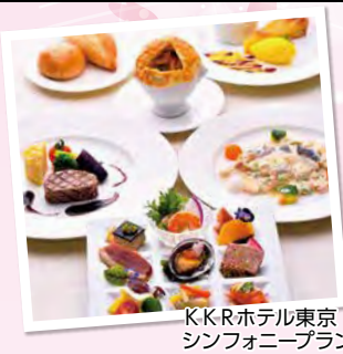
KKRホテル東京 シンフォニープラン