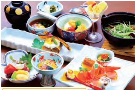
月替わりの創作料理 木賀会席

調理場に入り、見よう見まねで勝手に魚を捌く練習をしていました。そこへ親方が突然入って来られ、これは怒鳴られるなど覚悟したところ、意外にも「おっ! 頑張ってるね!!」と褒めてもらえました。多分あの時怒られていたら、調理