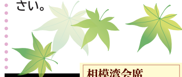
相模湾会席 伊勢海老のお造り

将軍家にも献上された「木賀温泉」の源泉を所有しております。庭園の樹木に囲まれたかけ流しの露天風呂と、私共の料理でゆるりと箱根の四季をお楽しみください。